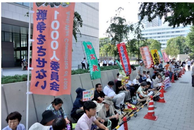
抗議の座り込み（7月15日、参議院議員会館前）