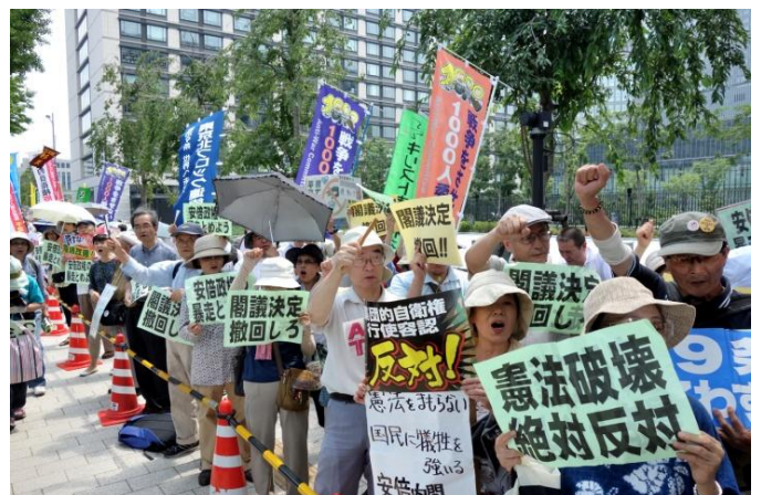
抗議集会（7月14日、衆議院議員会館前）